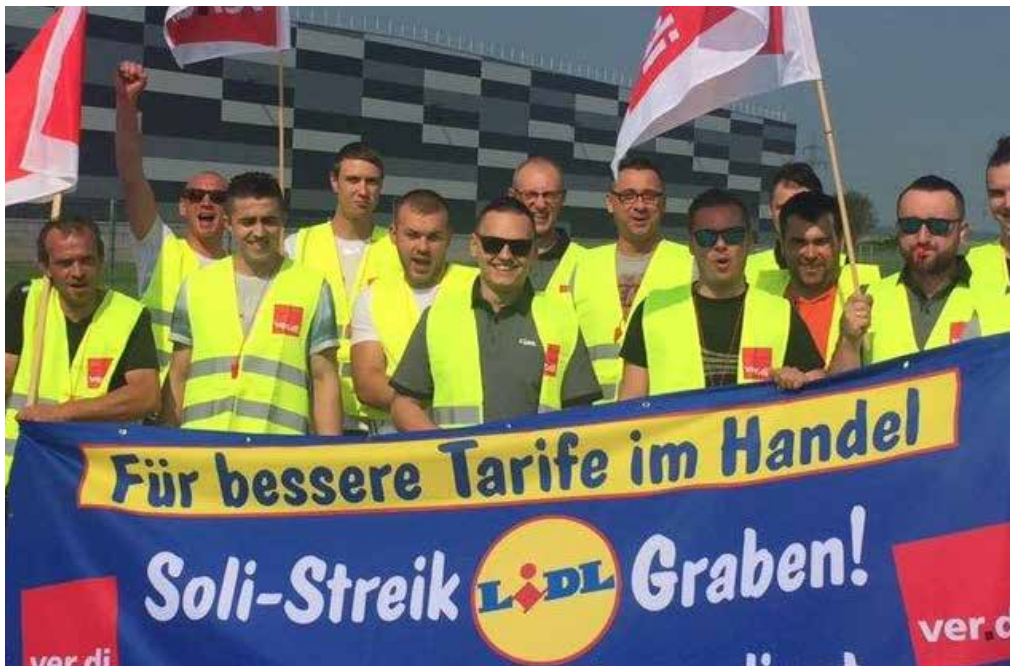
Solidaritätsstreik bei LIDL in Graben