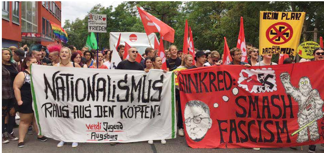
Augsburger ver.di Jugend bei der Demo am Freitag in Augsburg